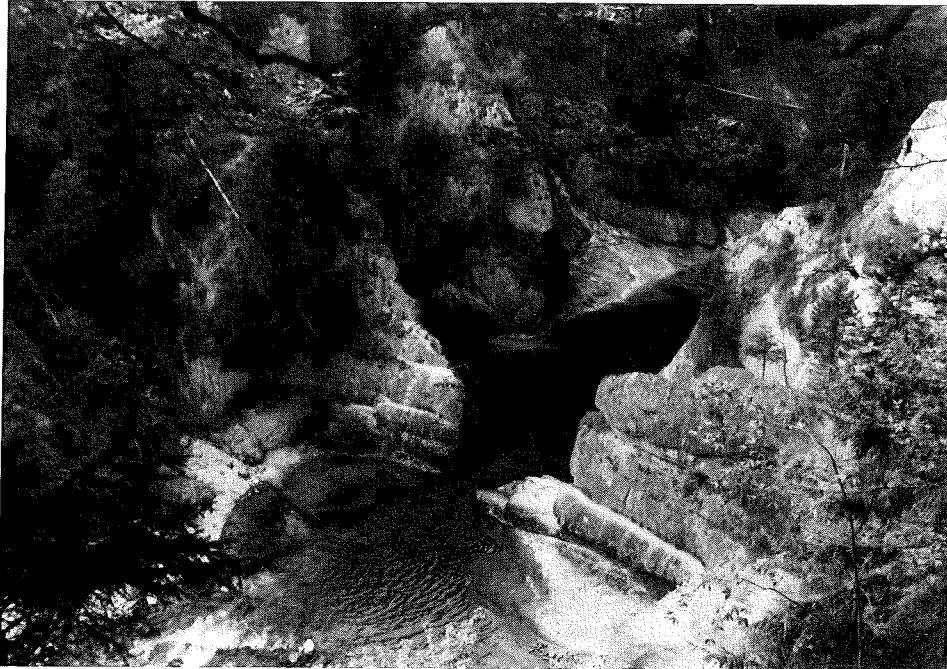
Abb. 1: Die stabilen Konglomerate der Weißsachsichten lassen die beiden Ufer im Bereich Scheibum bis auf wenige Meter zusammenrücken.

Das Gebiet liegt am Eintritt des Flusses in die Schlucht, wo durch starke Tiefenerosion aufgrund des Gefälles die durch die Alpenfaltung senkrecht gestellten Tonmergel-, Baustein-, Weißsach- und Steigbachschichten der unteren Meeresmolasse aufgeschlossen wurden. Während die Tonmergelschichten im Bereich Kammerl den nächstälteren Flyschschichten noch relativ ähnlich sind, treten in den Bausteinschichten Nagelfluhbänke und Sandsteine mehr in den Vordergrund. Sie wurden, wie der Name andeutet, wegen ihrer Stabilität als Baumaterial verwendet. Die Weißsachsichten zeichnen sich durch Nagelfluhbänke mit Mächtigkeiten bis 25 m (KUNERT und HALFLE 1969) und auffällige Rotfärbung aus. Diese stabilen Konglomerate bilden die Schluchtenge Scheibum. Von den Schleierfällen an gehören die Schluchteinhänge den Steigbachschichten an, die bis Kreut sehr mergelreich sind und von dort bis zur Sojermühle aus einer mächtigen Sandsteinfolge bestehen.