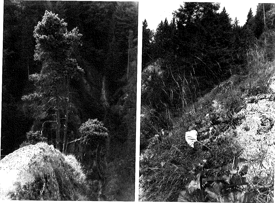
Abb. 2: Die Nagelfluhbänke tragen ein Vegetationsmosaik aus offenen Felsfluren, Blaugrashalden und lückigen Bergkiefernbeständen.