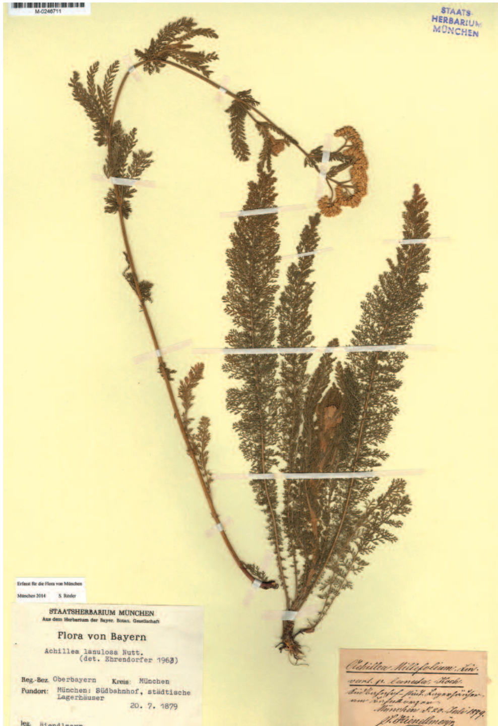
Abb. 1: Der Münchner Beleg von Achillea lanulosa .