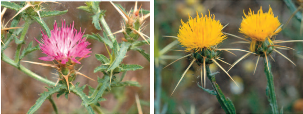
Abb. 2: Centaurea calcitrapa (links) und C. solstitialis (rechts) bei Greßthal.