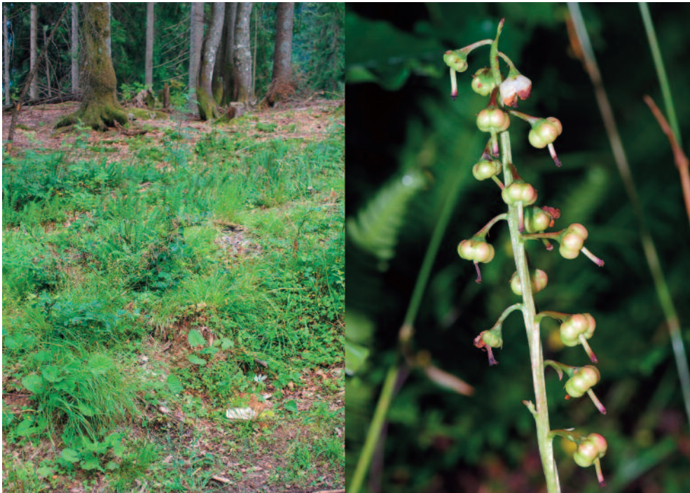
Abb. 7: Pyrola media am Söllereck bei Oberstdorf.

Pyrola media Sw. ist die seltenste der vier Wintergrün-Arten in Bayern und wurde auf Grundlage von Untersuchungen in Oberfranken (ULMER 2013) ins Artenhilfsprogramm des Landesamtes für Umwelt aufgenommen (ELSNER & ULMER 2015). Aus den Ergebnissen der Untersuchung wurde ein neues „Merkblatt Artenschutz“ erstellt (LfU 2016), welches den kritischen Zustand der Art in Bayern verdeutlicht. Außerhalb der Alpen ist die Art vom Aussterben bedroht, aber auch in den bayerischen Alpen stark gefährdet (SCHEUERER & AHLMER 2003). Bereits DÖRR & LIPPERT (2004) weisen auf den starken Rückgang der Art im Allgäu hin: „Die Art gehört zu den besonders stark gefährdeten Pflanzen, wobei eine unmittelbare menschliche Einwirkung kaum eine Rolle spielt. Sie verschwindet mehr und mehr auch an Wuchsorten, die nicht verändert wurden.“ Der aktuellste bayerische Fundpunkt in der Flora des Allgäus (DÖRR & LIPPERT 2004) ist von 1968. In der Datenbank der Artenschutzkartierung (ASK) findet sich ein Nachweis von Dörr aus dem Jahr 1981 „zwischen Breitengern- und Buchenrainalpe“. In der Flora des Allgäus ist nur der Fundort „zwischen Einödsbach und der Buchrainalpe (D 1967; um 1970 verschwunden)“ aufgeführt. Ob hier ein Fehler in der ASK vorliegt oder Dörr den Fund