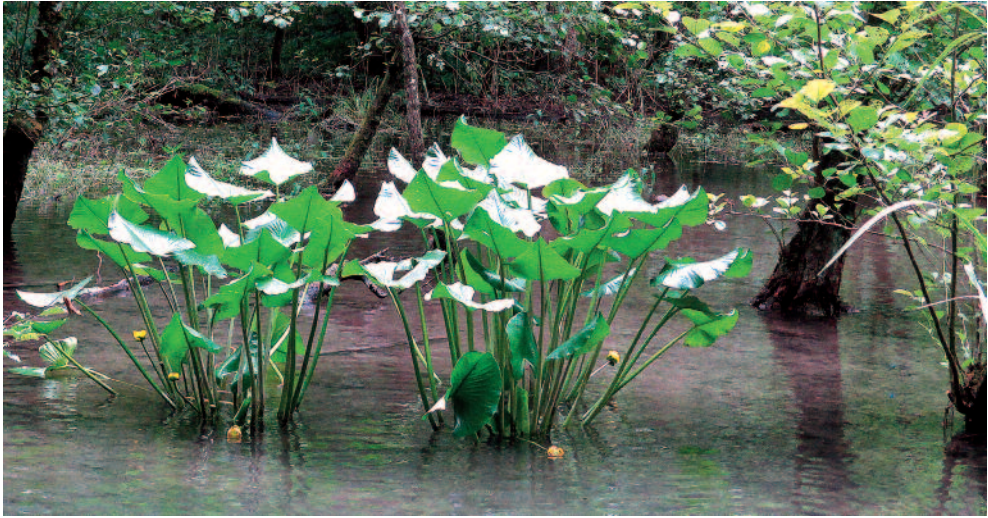
Abb. 6: Nuphar advena in der Würm; sehr auffällig die weit über die Wasseroberfläche ragenden Blätter, 18.07.2015.

Der Autor konnte die Art am 1. August 2016 an selber Stelle wiederfinden; zusätzlich zu diesem Vorkommen fanden sich in 20-30 m Entfernung weitere ca. 30 Pflanzen halb versteckt hinter hohen Gräsern, deren Lage eine neuere Ansiedlung als wahrscheinlich annehmen lässt. Eine weitere Fundstelle liegt ca. 2 km Luftlinie östlich im Buchendorfer Gemeindewald. Es handelt sich um einen Biotopweiher voller angesalbter Arten (siehe unten), das Werk von „Pflanzenfreunden“, die es gerne bunt haben wollen.