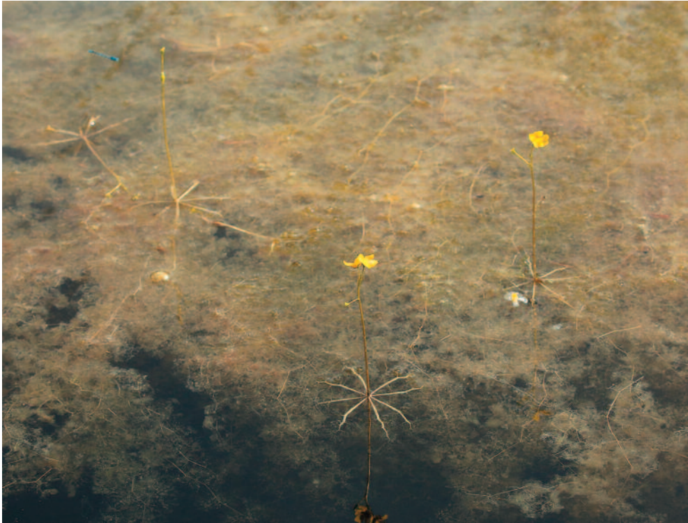
Abb. 11: Utricularia inflata in einem Mooresee bei Sicking, 22.07.2016.