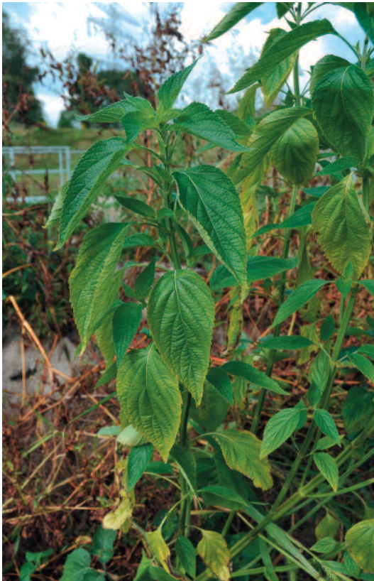
Abb. 8: Salvia hispanica auf einer Deponie in Braunau/Höft, Österreich, 05.09.2016.